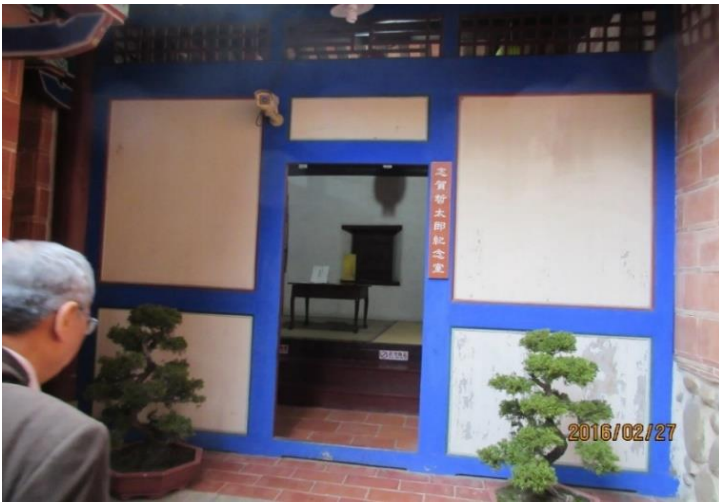
志賀哲太郎紀念室入口