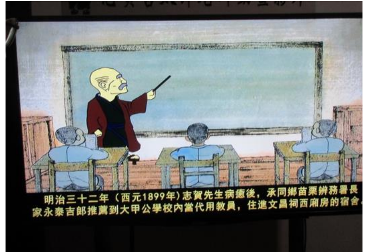
哲太郎を紹介する漫画動画