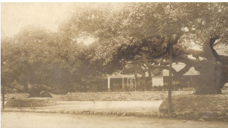
校内の大樹 昭和8(1933)年撮影