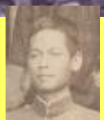
雇 黃並傳 (教え子)